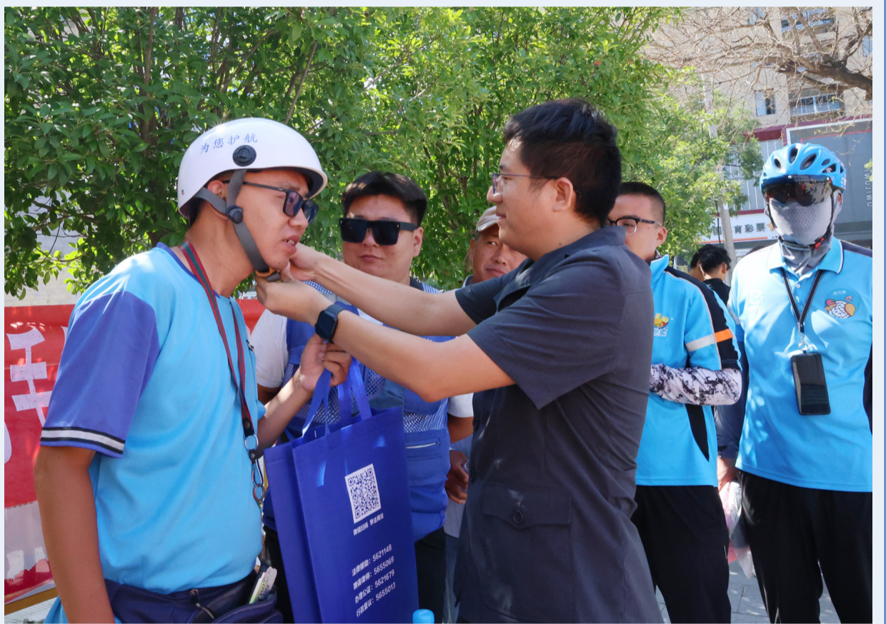
为更好满足新就业形态劳动者法律服务需求，近日，宁阳县人民法院联合多部门面向40名“外卖小哥”开展交通安全法治教育活动。法院干警通过法治讲座、互动问答的方式，深入讲解了《中华人民共和国劳动法》《中华人民共和国道路交通安全法》等法律法规，介绍遭受人身损害后进行诉讼维权的注意事项，引导“外卖小哥”增强法律意识、安全意识，遵守交通规则，安全文明送单。活动最后，法院干警向“外卖小哥”发放了普法宣传单40余份，并赠送了头盔和部分生活用品。图为干警帮助“外卖小哥”佩戴安全头盔。

做实做细“三强三优”，要以“政治素质”为根本。人民法院是政治性很强的业务机关，更是业务性很强的政治机关。做实做细“三强三优”，首要的是加强政治素质建设，坚持不懈用习近平新时代中国特色社会主义思想凝心铸魂，强化“从政治上看、从法治上办”的能力水平。要始终把讲政治放在首位，坚持党的绝对领导，充分发挥政治优势、制度优势，