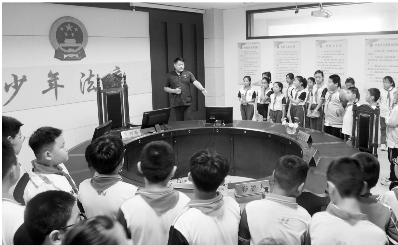
近日，五莲县人民法院邀请五莲县育才小学50余名师生参加“法院开放日”活动，“沉浸式”上好“法治第一课”。

活动中，学生们先后参观了第一审判庭、诉讼服务中心、党建文化长廊、初心学堂、少年法庭等处，实地感受法院的庄严，了解法院工作。每到一处，法院干警进行详细讲解，学生们认真聆听记录，潜移默化地在心间种下了法治的种子。图为学生们参观少年法庭。